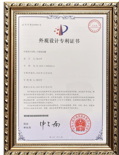
Brevet n °: 201630655323.4