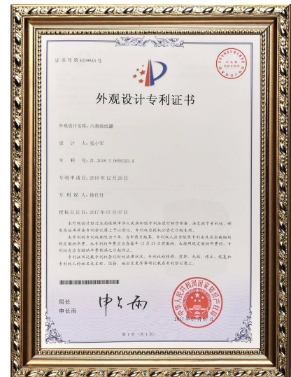
Brevet n °: 201630655323.4