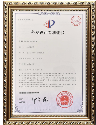
Numéro de brevet: 201630655323.4