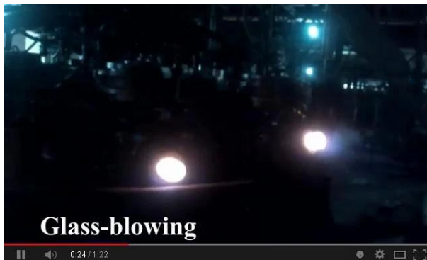
Technologie de soufflage à la machine

Regardez ici notre vidéo de ligne de production en ligne, bienvenue pour nous rendre visite sur place.