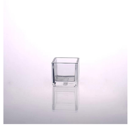
bougeoir carré en verre décor à la maison