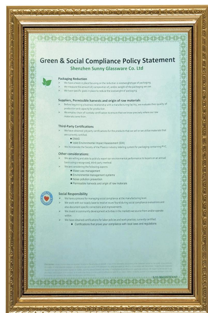
Πράσινη και κοινωνική συμμόρφωση Δήλωση Polydy