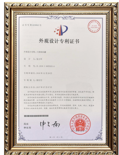
Αριθμός ευρεσιτεχνίας: 201630655323.4