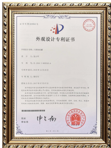
Δίπλωμα ευρεσιτεχνίας Αριθ.:201630655323.4