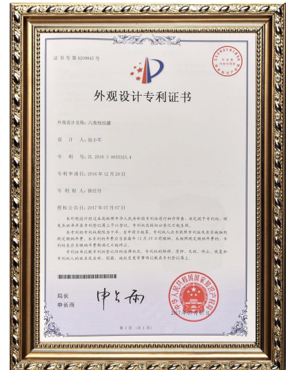
Δίπλωμα Ευρεσιτεχνίας 20:2030655323.4