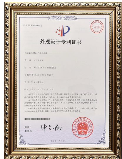
Δίπλωμα Ευρεσιτεχνίας: 201630655323.4