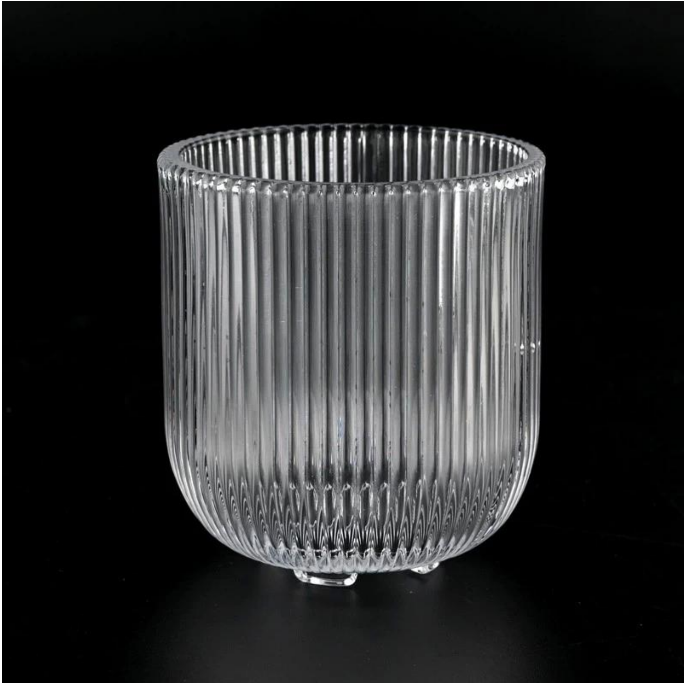
Pribor za svijeće