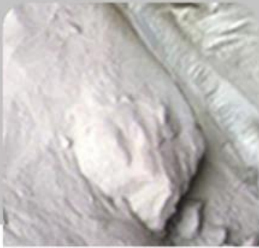
1、 Raw Material