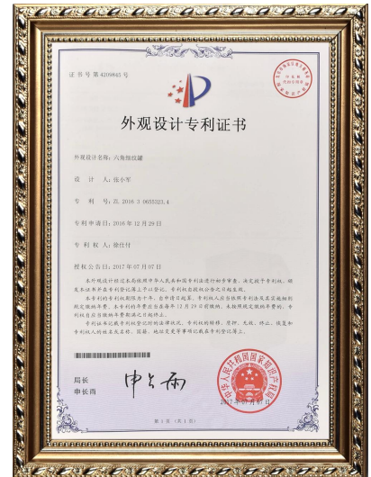
Patent br.: 201630655323.4