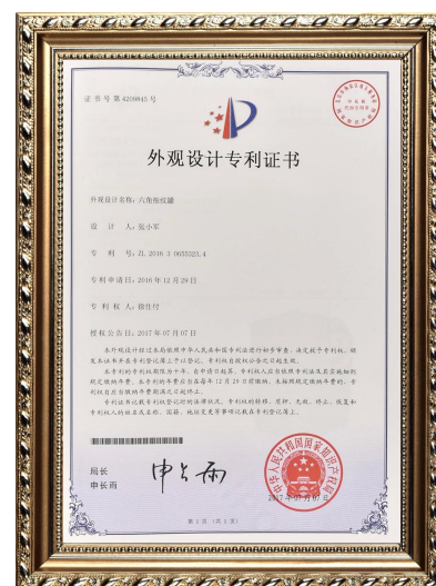
Patent No.: 201630655323.4