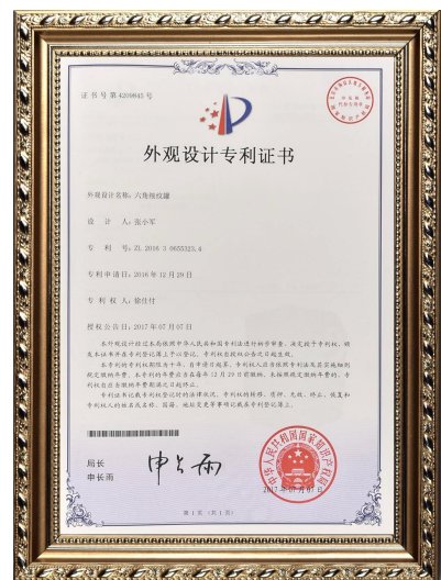
Patent br.: 201630655323.4