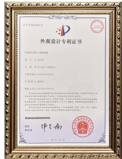
Patent br.: 201630655323.4