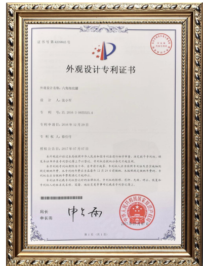
Patent br.: 201630655323.4