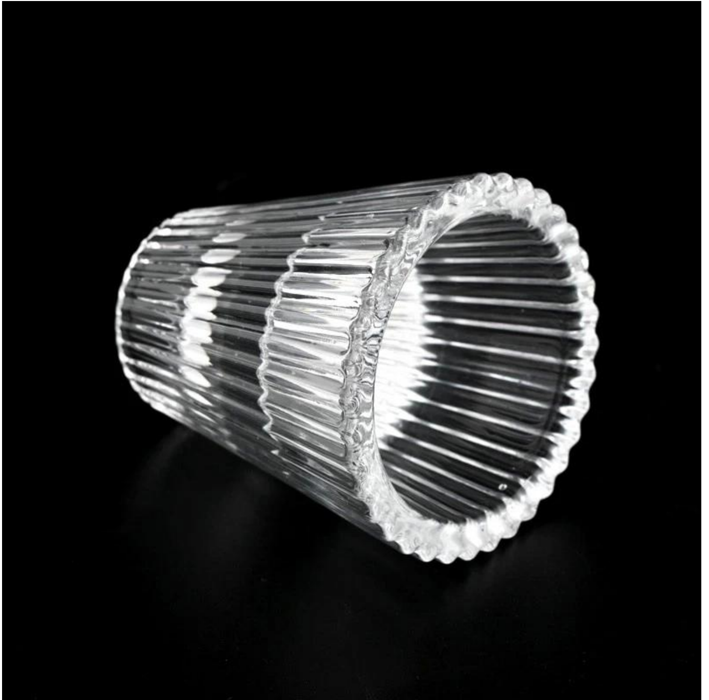
alat ekstra lilin