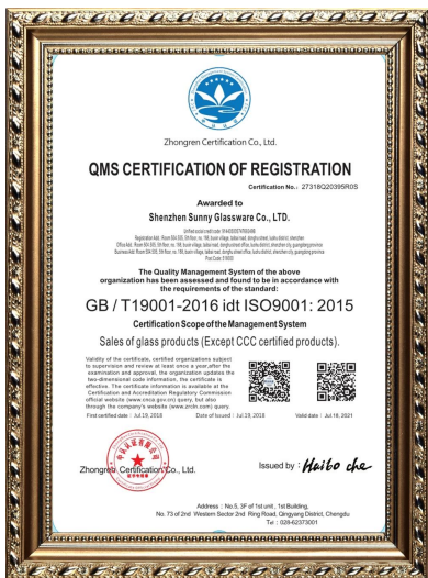
ISO 9001: 2015