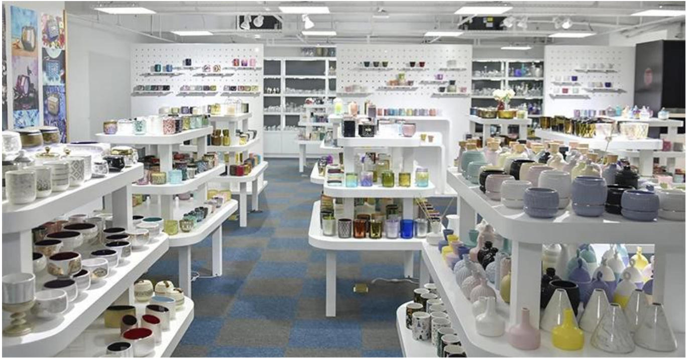
Glass Produksi Garis