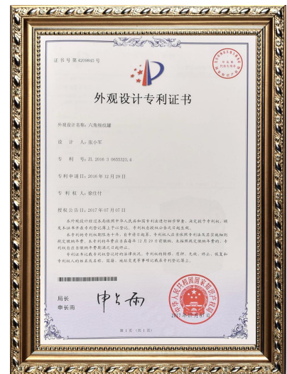
Nomor Paten: 201630655323.4