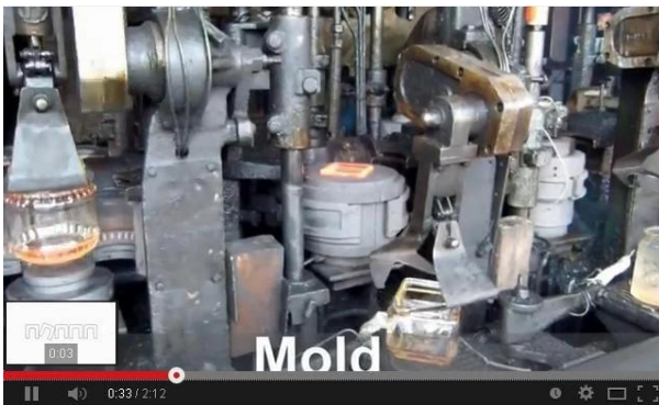
Teknologi Mesin IS