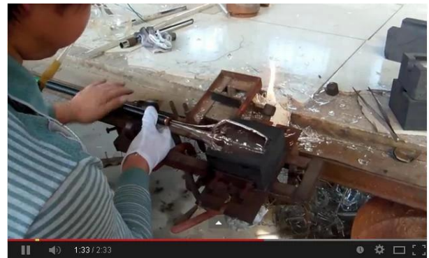
Teknologi Hand Blown