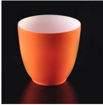
Tempat lilin keramik warna orange dengan dinding lebih tipis