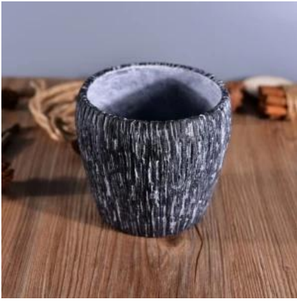
Tempat lilin beton dekoratif kosong