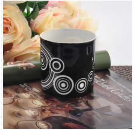
Grosir botol keramik silinder berkualitas tinggi