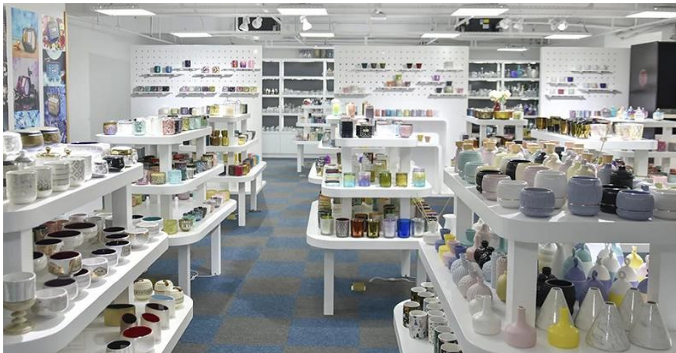
Glass Framleiðsla Lína