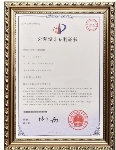
Numero di brevetto: 201630655323.4