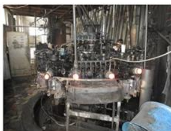
□ Machine Blown