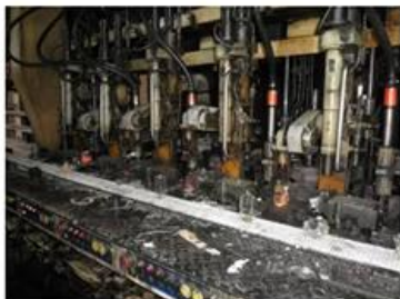
□ IS Machine