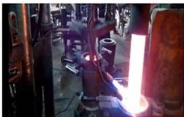
□ Machine Pressed