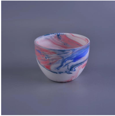
Candela profumata in ceramica decorativa fatta a mano in cera di soia