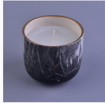
Candele profumate in marmo in portacandele in ceramica con stampa decalcomania in marmo