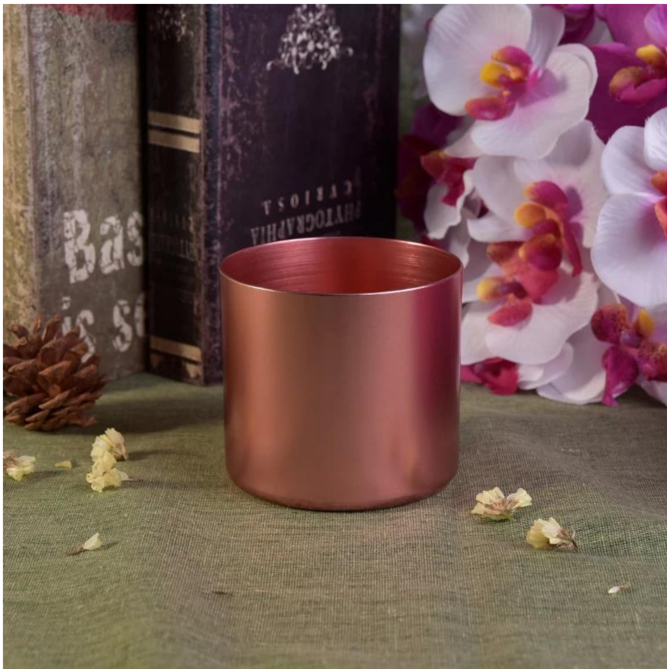
Spettacolo di fabbrica