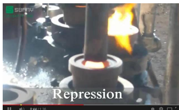
Tecnologia della pressa a macchina