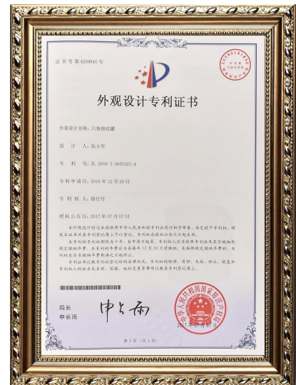
Numero di brevetto :201630655323.4