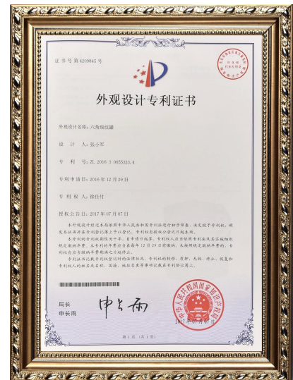
Numero di brevetto :201630655323.4