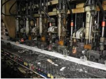
□ IS Machine