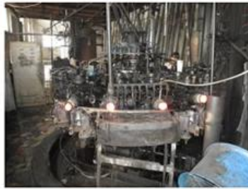
□ Machine Blown