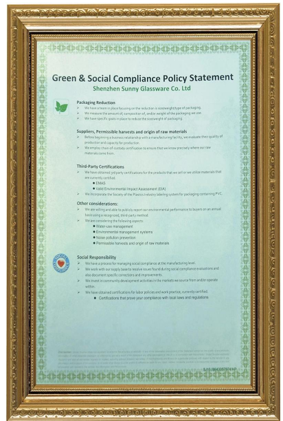
Green & Social □□□□□ Polidy □