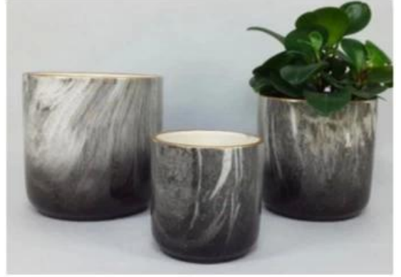
S15107-150 15.5x15.5x15cm S15107-125 13.5x13.5x12.5cm S15107-100 10x10x10cm