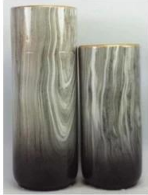
S15106-315 12x12x31.5cm S15106-245 11x11x24.5cm