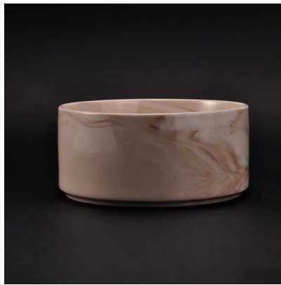
玻璃碗 20 个装