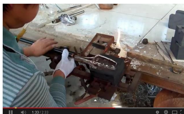
Rankomis pūtos technologijos