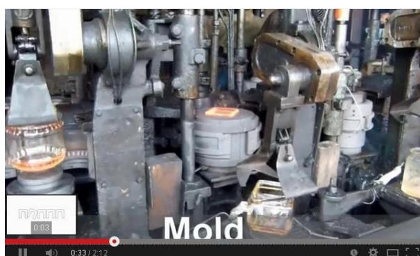
IS mašinų technologija