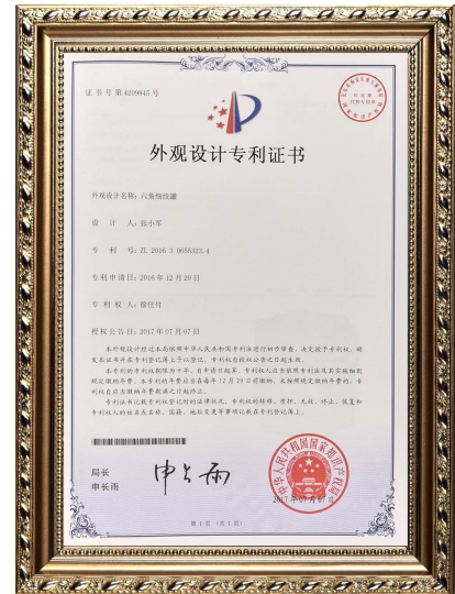
Patentas Nr.: 20163065323.4