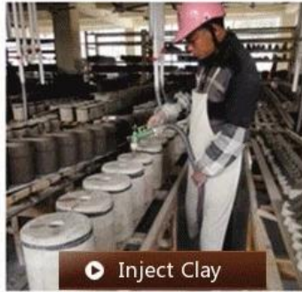
▶ Inject Clay