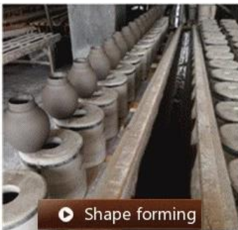
▶ Shape forming