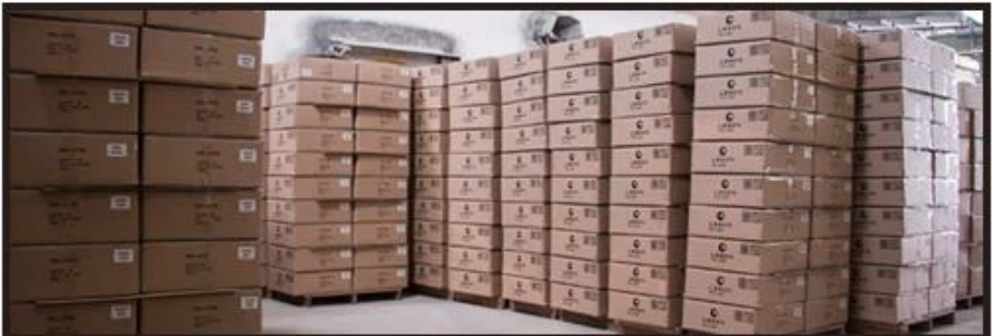
Ready to loading