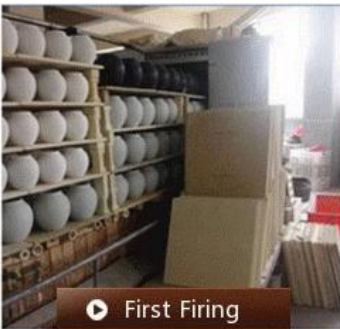
▶ First Firing