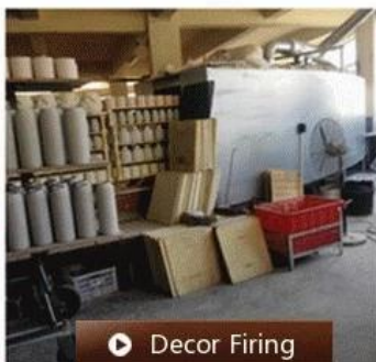
▶ Decor Firing