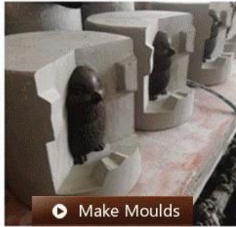
▶ Make Moulds