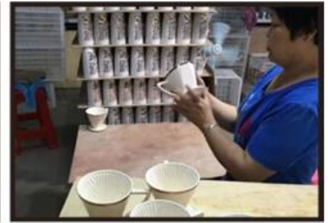
Inspection the decal product