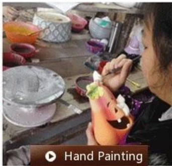
▶ Hand Painting