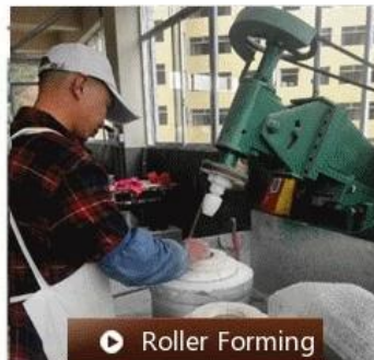
▶ Roller Forming