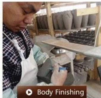
▶ Body Finishing