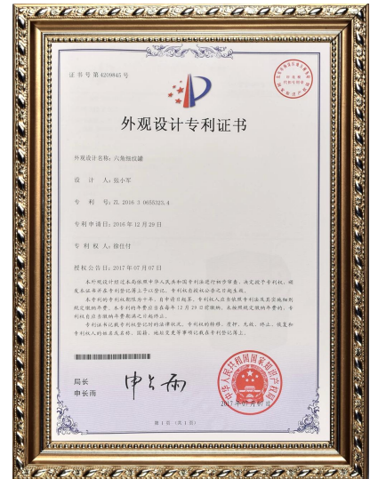
Patentas Nr.: 201630655323.4