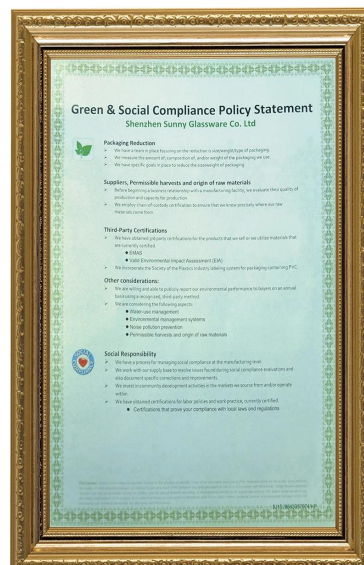
Žalioji ir socialinė atsakomybė Polidų pareiškimas