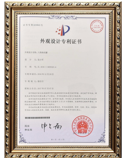
Patento Nr.: 201630655323.4