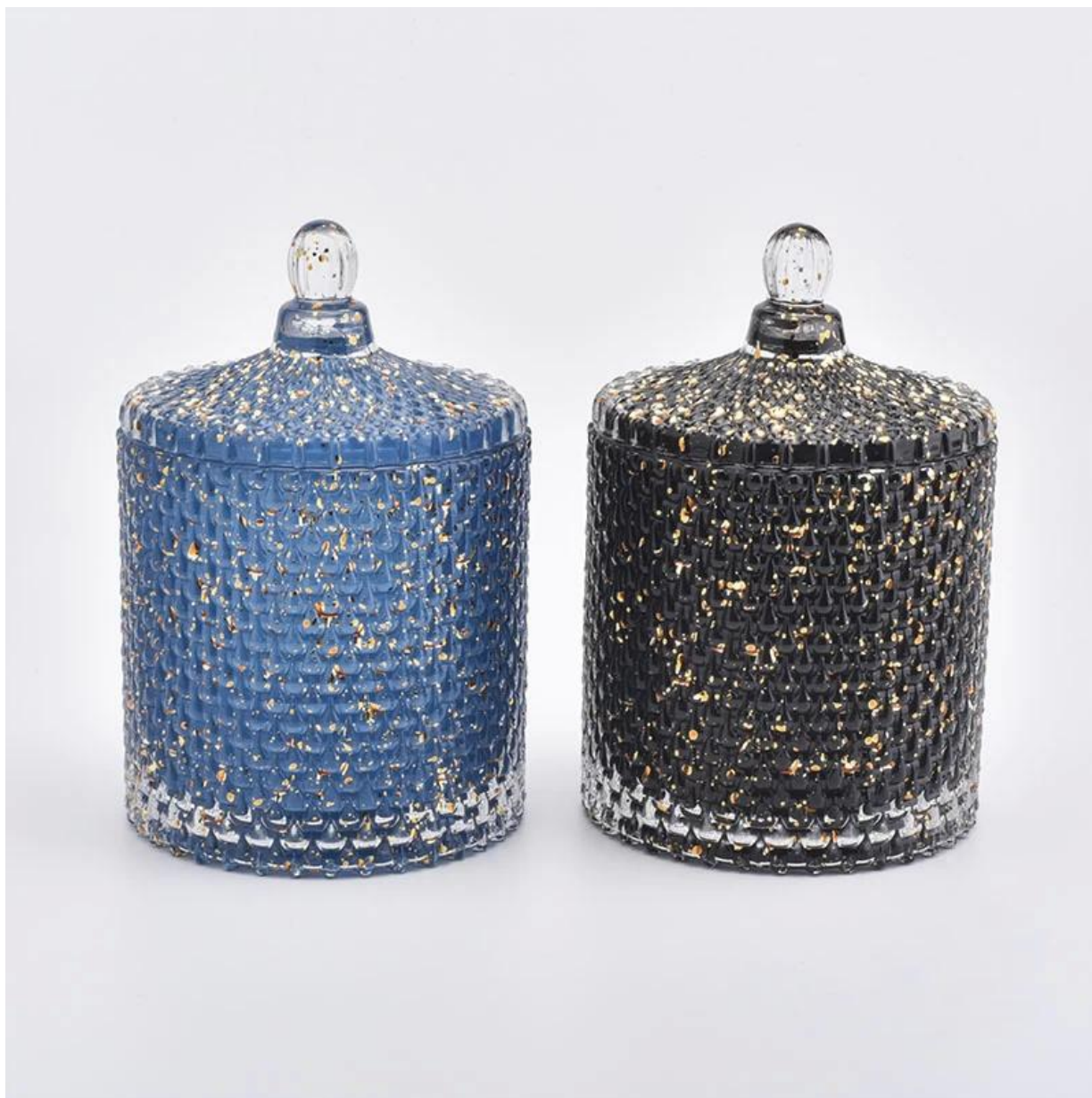
Kāpēc izvēlēties Sunny Candle holder