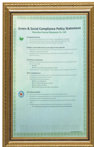
Zaļā un sociālā atbildība Polidija paziņojums