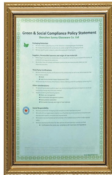
Tanggungjawab hijau dan sosial Penyataan Polidy