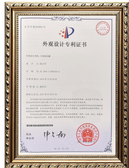
No. Paten: 201630655323.4