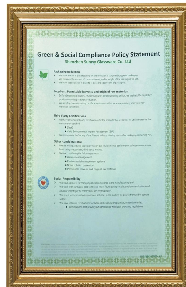
Tanggungjawab hijau dan sosial Penyataan Polidy