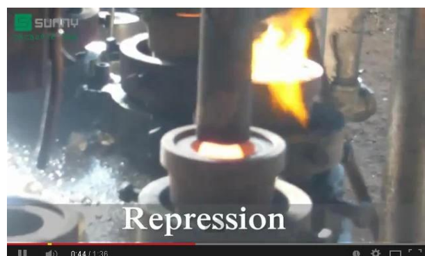
Teknologi Mesin Press