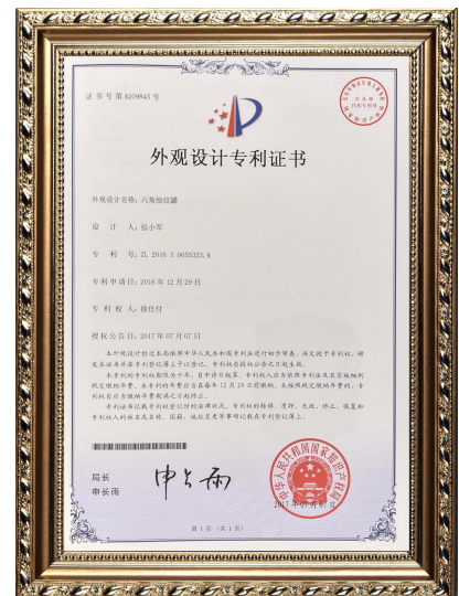
No. Paten: 201630655323.4