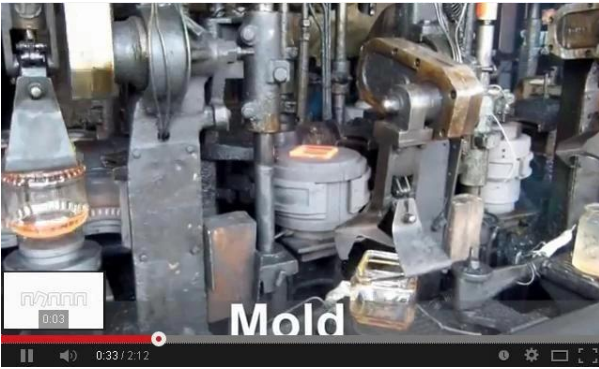
Teknologi Mesin IS