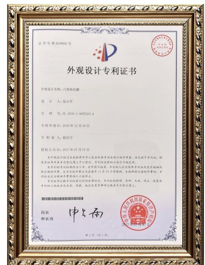
Nummer octrooien: 20163065323.4