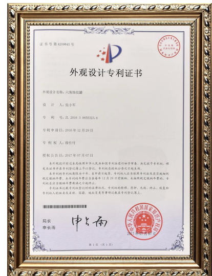
Octrooi nr.: 201630655323.4