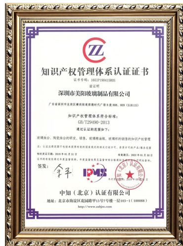
Enterprise Intellectual Eigendom Octrooi & Nr.:201630655323.4