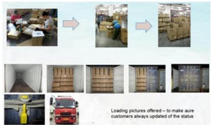
Packing & Loading