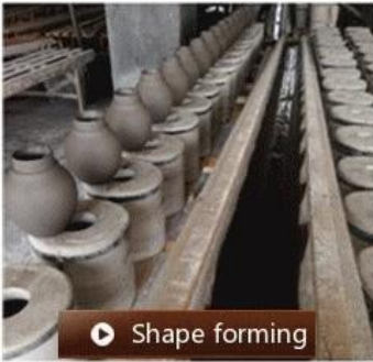
▶ Shape forming