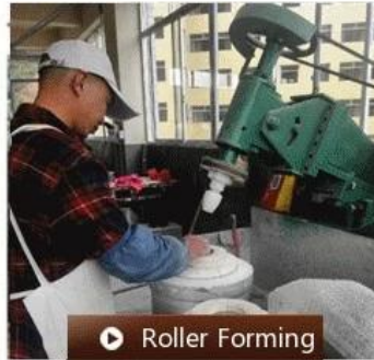
▶ Roller Forming