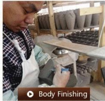
▶ Body Finishing