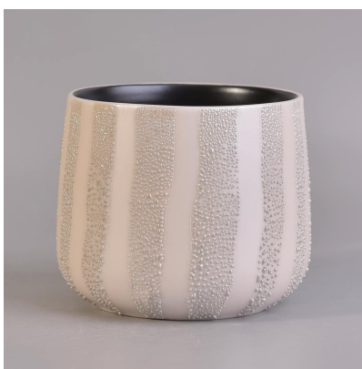
Matt sort på innsiden av keramiske glaserte fargerike lysglass