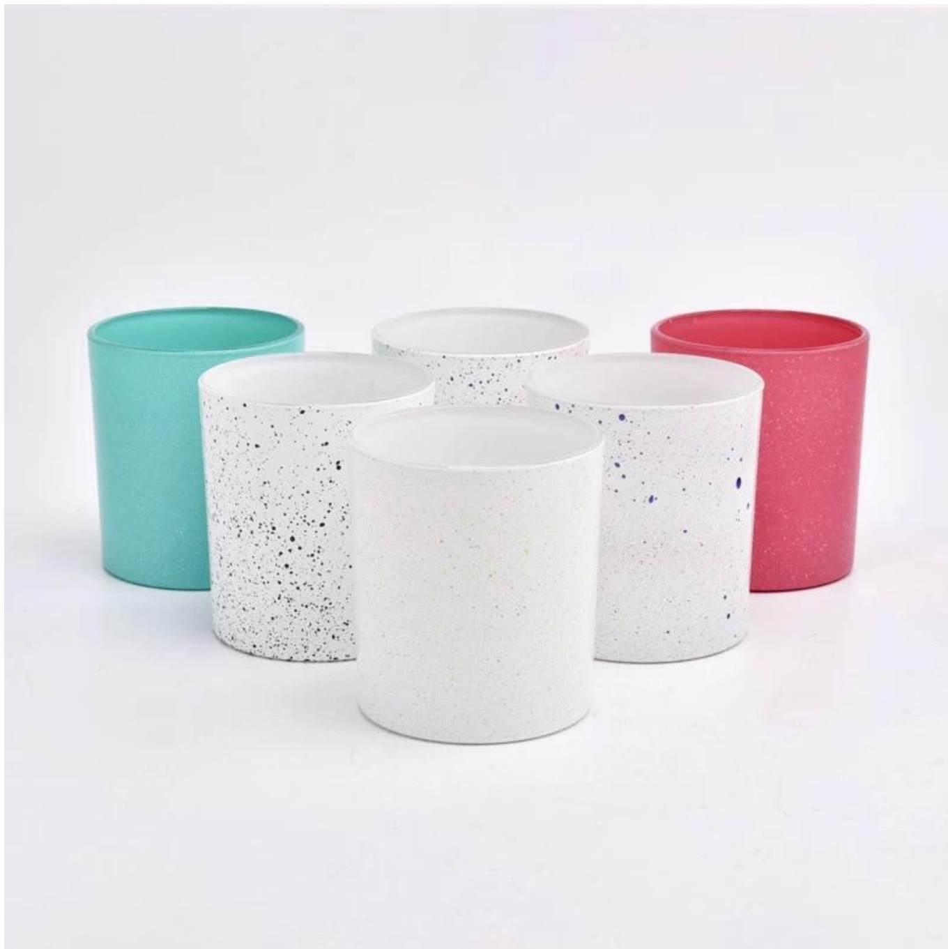
Mga kagamitan sa kandila