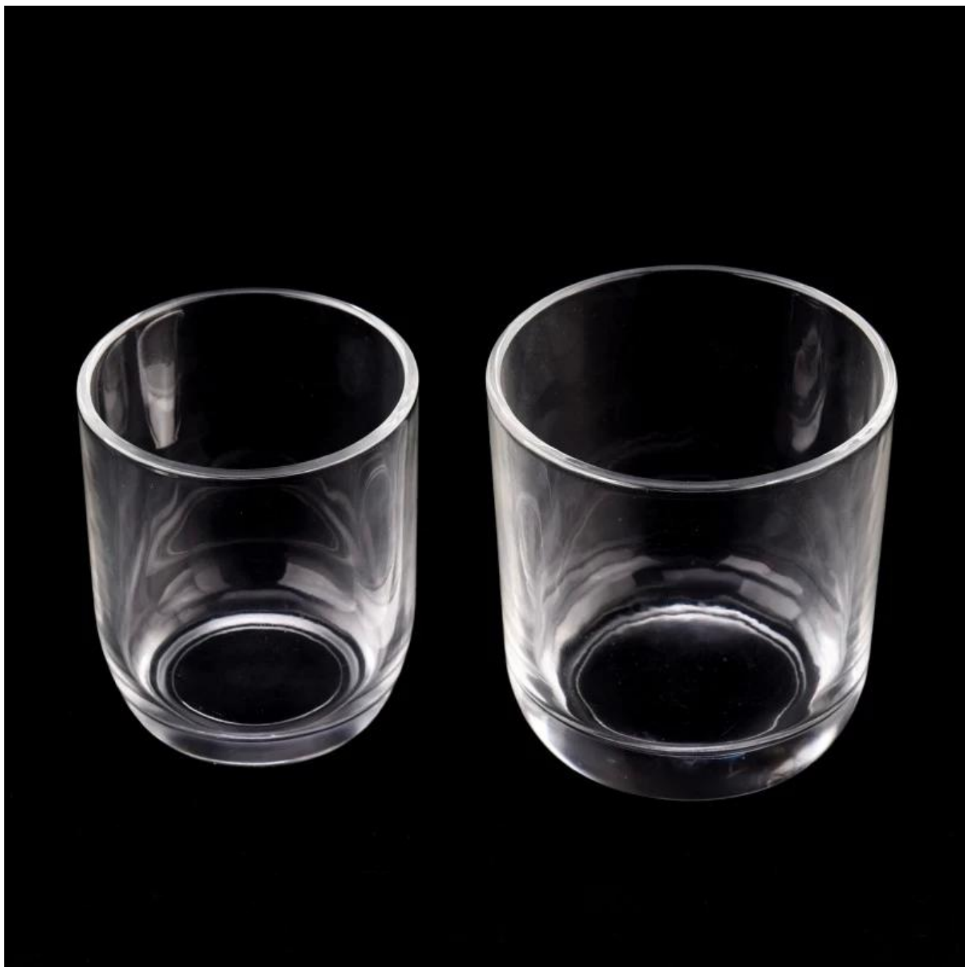
Mga kagamitan sa kandila