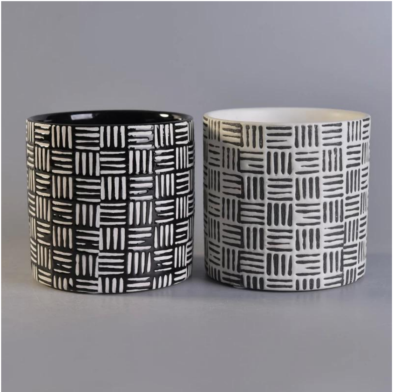
Mga katugmang accessories: