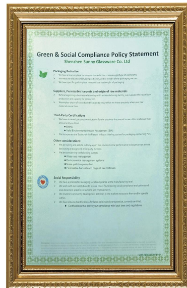
Green at responsibility sa lipunan Pahayag ni Polidy